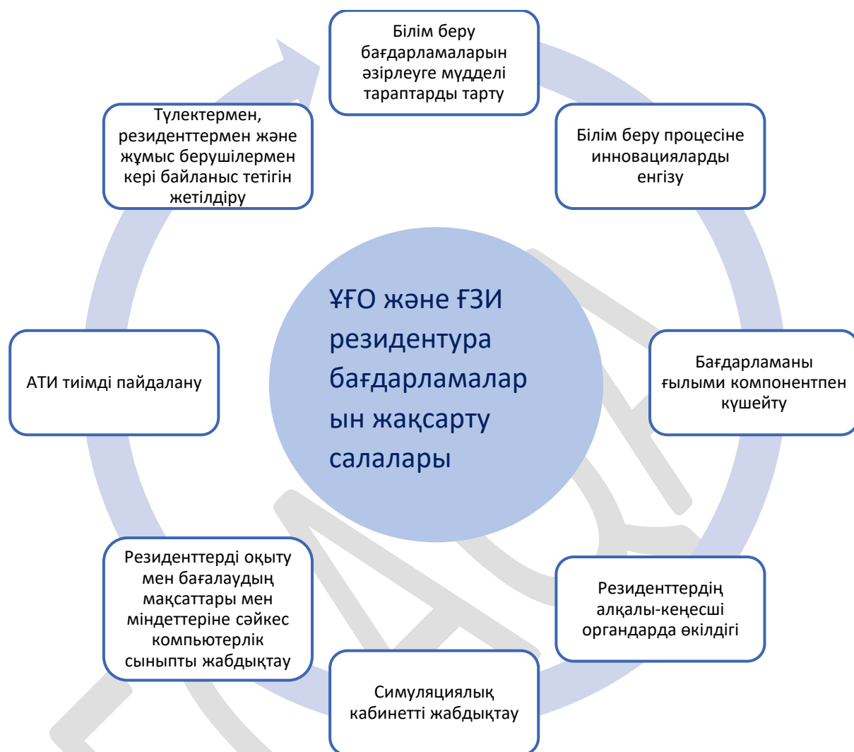
1-Схема. ҰҒО және ҒЗИ резидентура бағдарламаларын жақсарту салалары

Резидентура бағдарламалары контекстіндегі ұйымдарды жақсарту бағыттары (1-кестені қараңыз) мыналар болып табылады (1-схема):