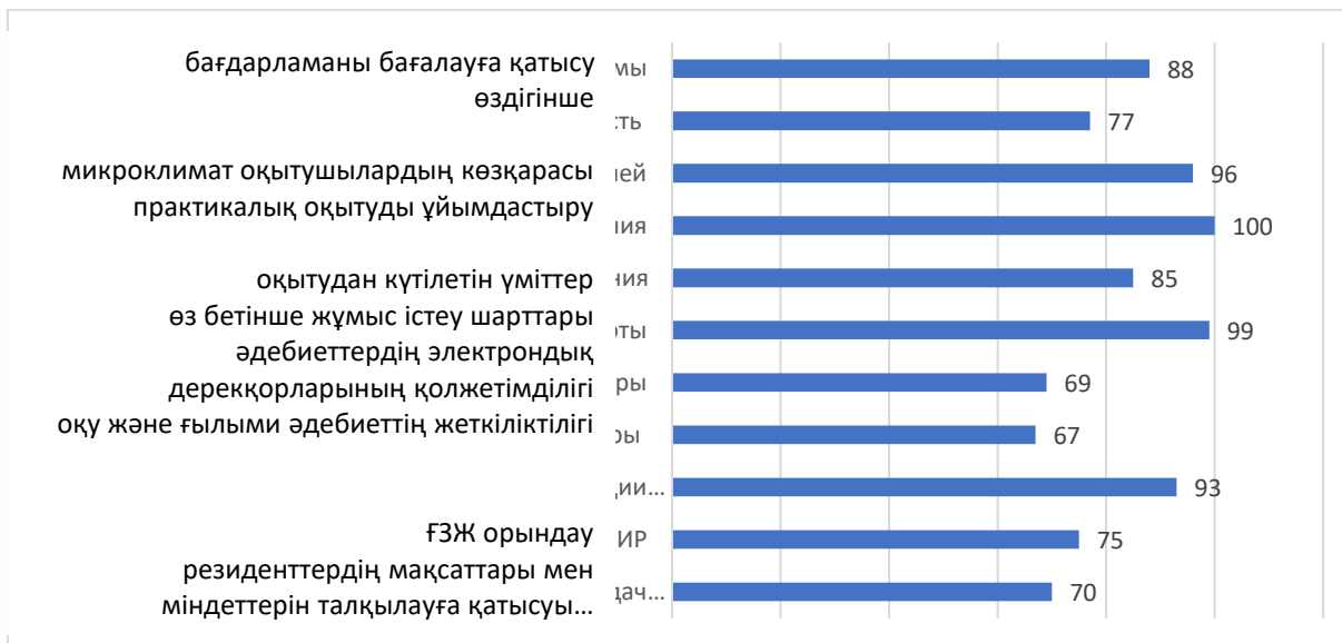
Диаграмма 3. Резиденттердің сауалнамасы (n=47), %

14 ұйымдағы 9 білім беру бағдарламасының 47 тұрғынына сауалнама бірқатар сұрақтарды қамтыды, олардың жауаптары 3-диаграммада көрсетілген.