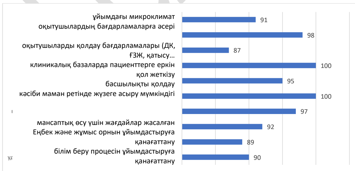
Диаграмма 4. Оқытушылардың сауалнамасы (n=56), в %

Айта кету керек, резидент респонденттер оқытуды ұйымдастыруға толық қанағаттанған. Сонымен қатар, резиденттерге дербестік жетіспейді, электронды мәліметтер базасы жеткіліксіз және оқу орнының кітапханасында Ғылыми әдебиеттер жетіспейді. Барлығы ҒЗЖ орындай бермейді және барлығы білім беру бағдарламасының мақсаттары мен міндеттерін талқылауға, элективтердің тақырыптарын қалыптастыруға қатыспайды (3-диаграмма).